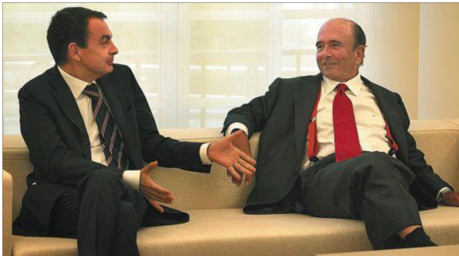
El presidente del Gobierno, José Luis Rodríguez Zapatero, charla con el presidente del Santander, Emilio Botín, ayer en La Moncloa.