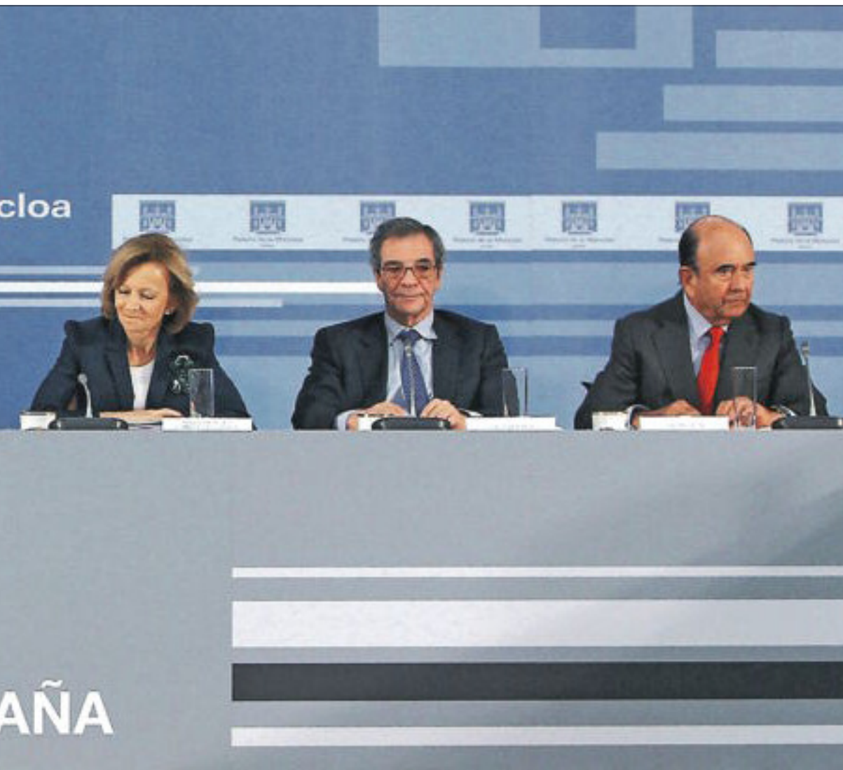
José Manuel Lara, Antonio Brufau, Juan Rosell, Alfredo Pérez Rubalcaba, José Luis Rodríguez Zapatero, Elena Salgado, César Alierta y Emilio Botín, en un momento de la reunión de ayer en La Moncloa.

a estar por encima de las cuestiones internas de su partido. Esta semana, por ejemplo, la dedicación a la política internacional y económica, coronada con su participación en la cumbre europea del jueves y viernes en Bruselas, no le ha dejado tiempo para atender a las cuestiones internas del PSOE.