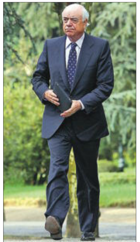
De izquierda a derecha, Gonzalo Urquijo (Arcelor Mittal), Rodrigo Rato (Bankia), César Alierta (Telefónica), Isidoro Álvarez (El Corte Inglés) y Francisco González (BBVA).