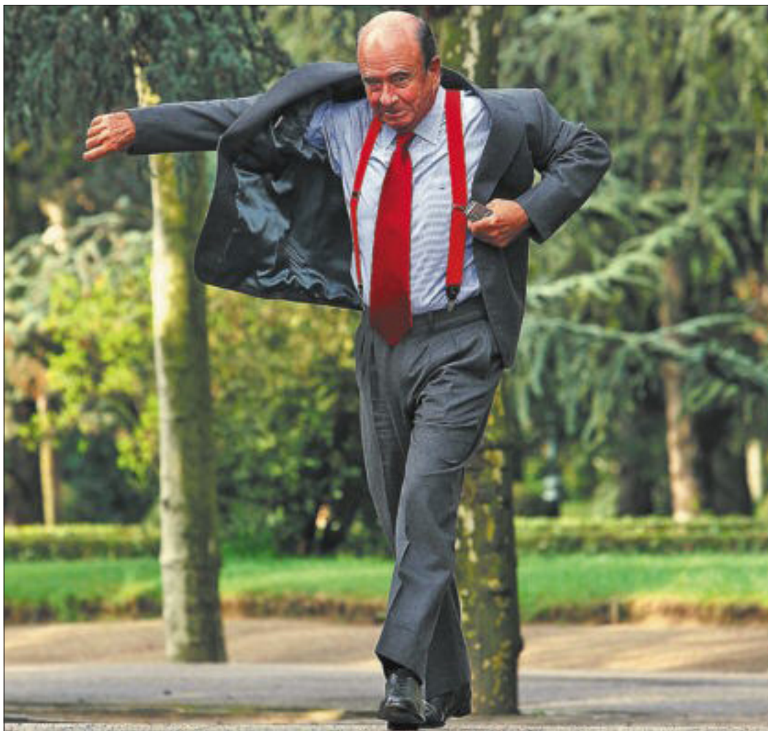
El presidente del Banco Santander, Emilio Botín, ayer en La Moncloa.

Zapatero quería escuchar la opinión de la élite empresarial —que suma la mitad del PIB— sobre las medidas que España abordará para cumplir el Pacto del Euro. El encuentro continuaba el celebrado el 27 de noviembre. Los empresarios reconocieron a Zapatero que desde entonces la estabilidad económica del país ha mejorado de “forma clara” como consecuencia de las reformas del Gobierno. “No hay ningún otro elemento [más allá de la recuperación económica] que condicione el calendario político, que tiene que ser siempre secundario a lo que este país tiene aún que hacer”, precisó el líder socialista. PASA A LAS PÁGINAS 20 A 22