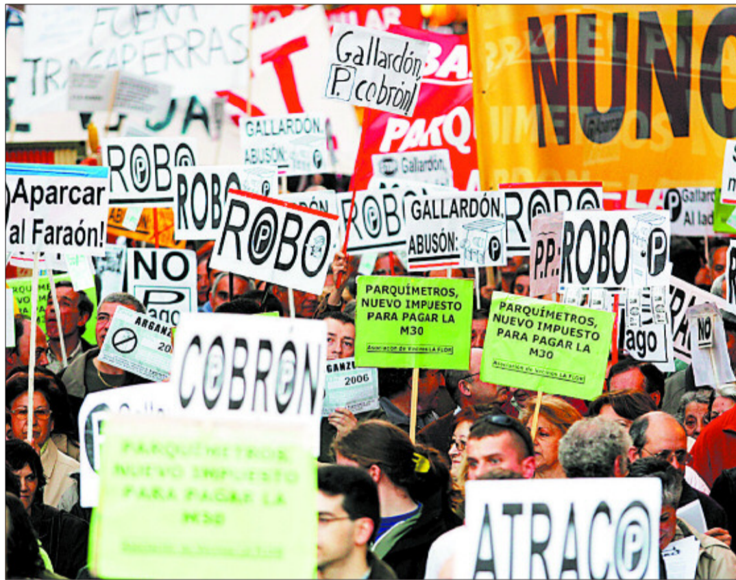
Vecinos de barrios periféricos de Madrid protestan contra la ampliación de los parquímetros.